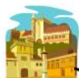
首都大学東京 健康福祉学部