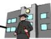
都立航空工業高専

来年に都立産業技術高等専門学校に生まれ変わり、情報通信、ロボット、医療福祉、航空宇宙工学コースが設置されます。荒川区は、高専と区内企業の皆様との連携を推進します。