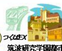
つくばエクスプレス 筑波研究学園都市

つくばエクスプレス開通により「筑波大学」「産業技術総合研究所」等との連携を一層強化していきます。